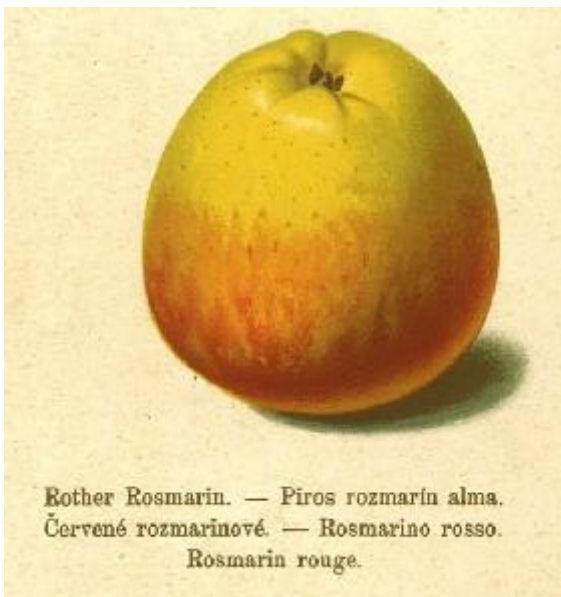
Rother Rosmarin. — Píros rozmarín alma. Červené rozmarínové. — Rosmarino rosso. Rosmarin rouge.